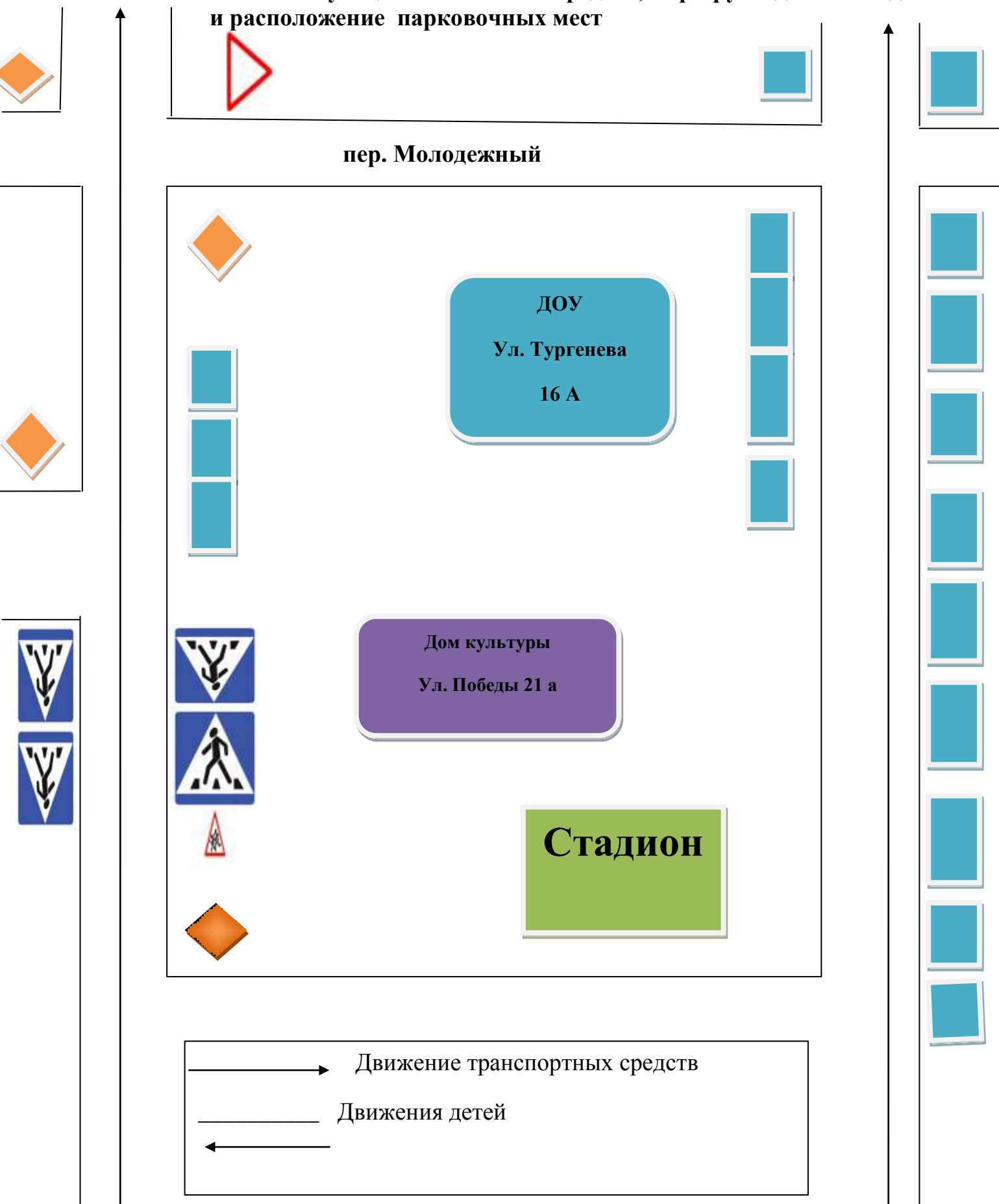
Схема организации дорожного движения в непосредственной близости от образовательного учреждения с размещением соответствующих технических средств, маршруты движения детей и расположение парковочных мест

Пути движения транспортных средств и детей.